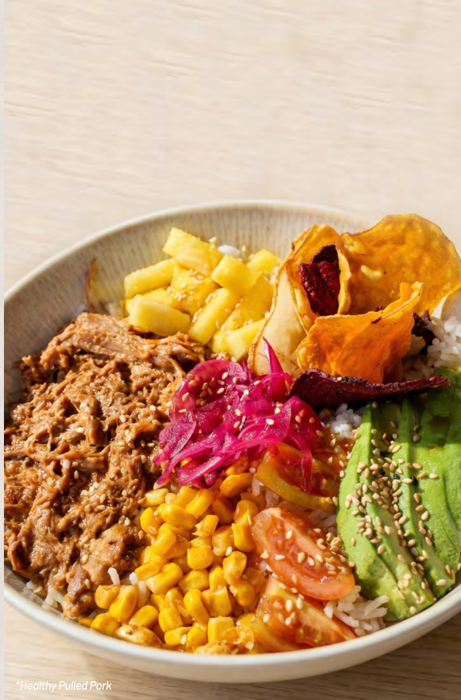
*Healthy Pulled Pork