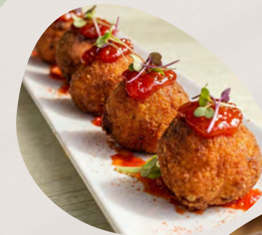
*Croquettes Jambon & Brie

Lanières de poulet frites avec pommes de terre.