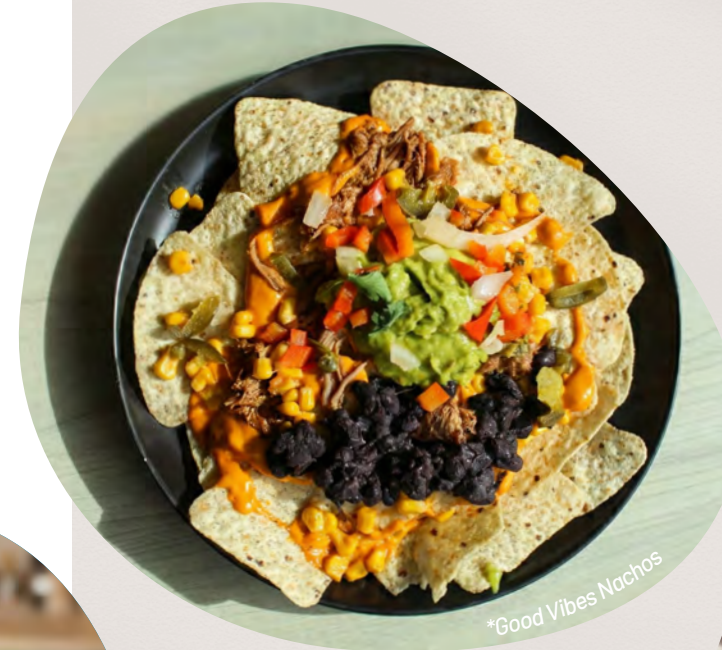
*Good Vibes Nachos