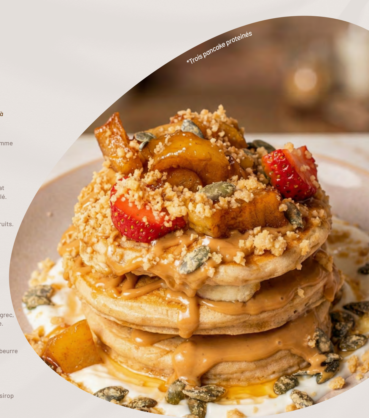
*Trois pancake protéinés

Beurre de cacahuète, noix de coco râpée, fruits et sirop de chocolat.