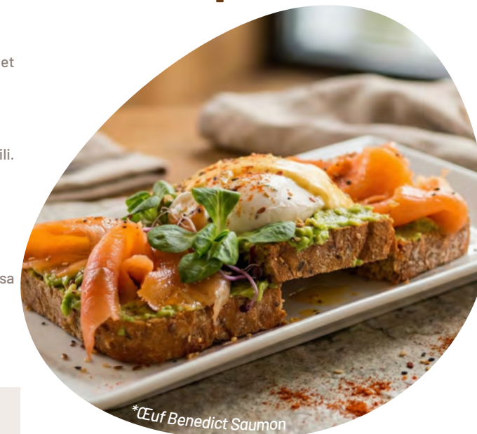
*Œuf Benedict Saumon