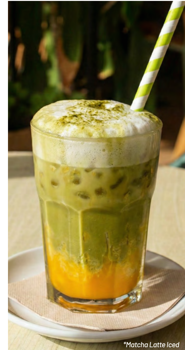
*Matcha Latte Iced